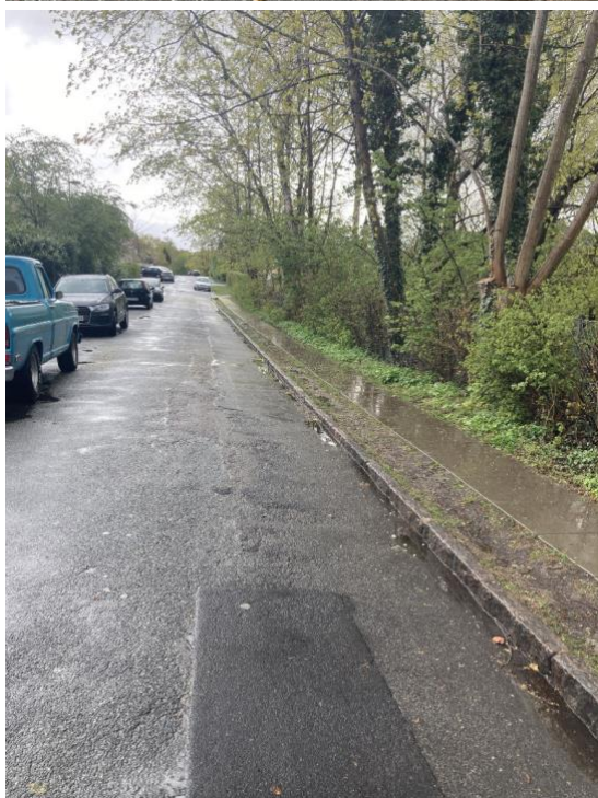
Fortovet mod atelierhusene