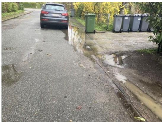
Fortovet ved Engblommevej 29-31

Kan generalforsamlingen godkende at bestyrelsen får udført det beskrevne projekt med et budget på max. Kr. 120.000,- incl. moms, selvom der er begrænset medlemstilslutning på det givne vejstykke?